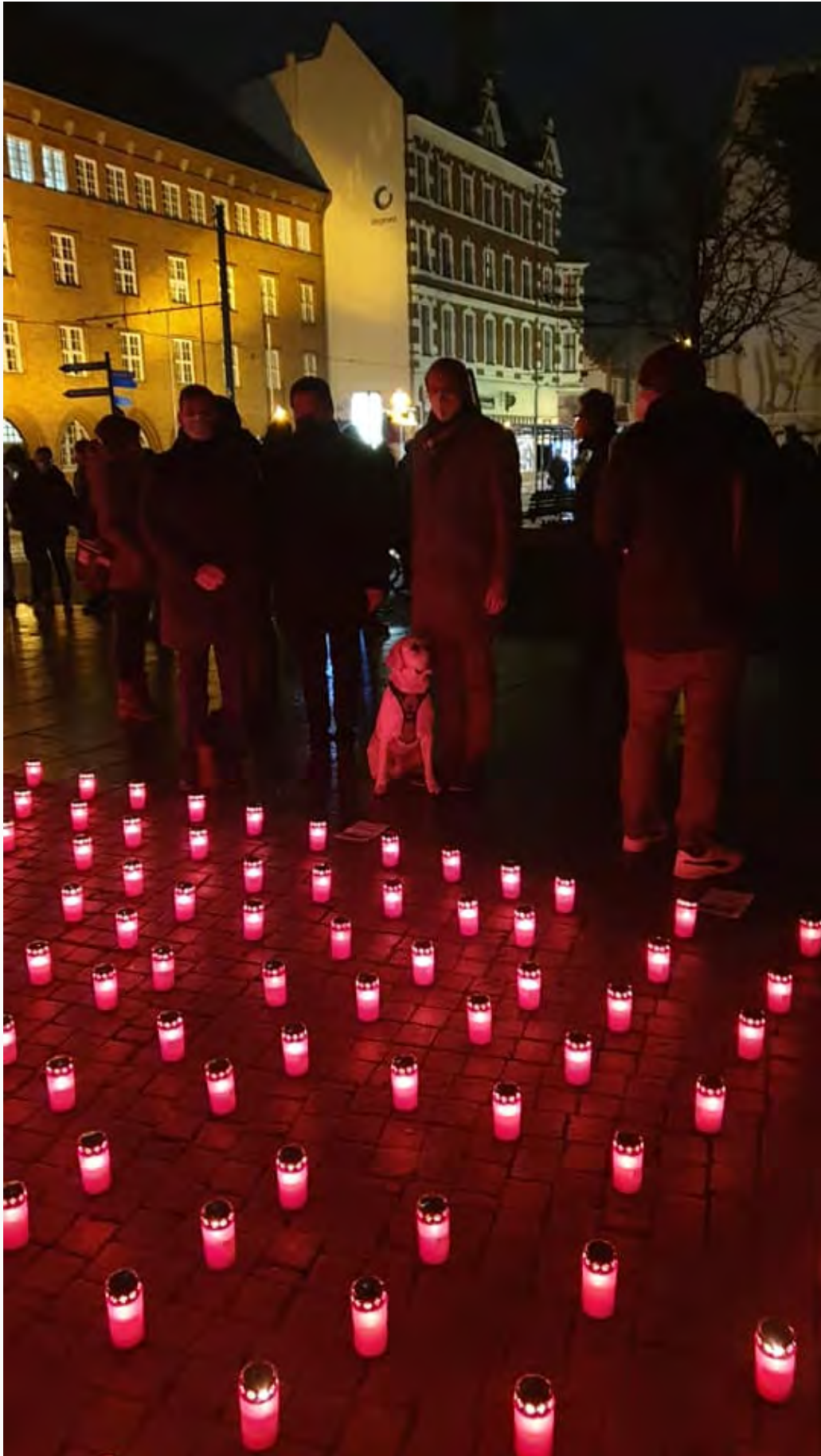
Treptow-Köpenick gedenkt der im Bezirk bisher am Corona-Virus Verstorbenen

Am 10. Januar wurde vor dem Rathaus Köpenick der bis dahin 246 Verstorbenen gedacht, die seit Beginn der Pandemie am Corona-Virus im Bezirk verstorben sind. „Obwohl ich